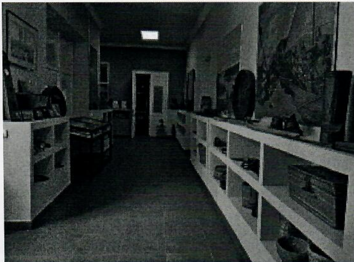
Слика 3.- Музејска посатава у ходнику

Радови на Спомен подручју Тиса, нису реализовани, иако је урађена комплетна документација за исту.